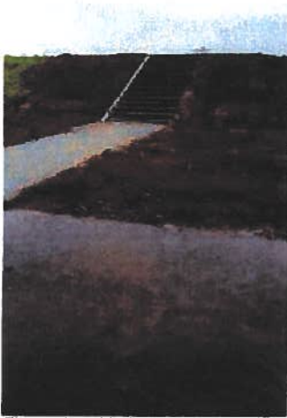
Figuur 1 verbindingstrap

De reconstructie van de toegangsweg naar het recreatiegebied Hoenderhoek is gelijktijdig uitgevoerd met het groot onderhoud aan beplanting, de fiets- en wandelpaden. De aanwezige dubbele infrastructuur is verwijderd. Hierdoor is de verkeerssituatie eenduidiger geworden. Tevens is een verbindingstrap gerealiseerd vanaf het fietspad op de dijk naar het recreatiestrand Hoenderhoek.