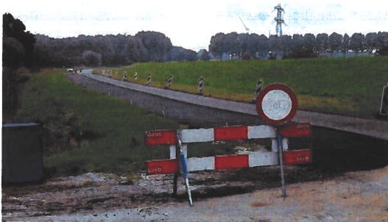
Figuur 2 reconstructie toegangsweg Hoenderhoek in uitvoering

De reconstructie en upgrade van de bestaande parkeerplaatsen Hoenderhoek, het opknappen van de stranden Hoenderhoek en Stompaardse Plas en het aanlegsteiger Geervliet zijn eind 2018 meervoudig onderhands aanbesteed. Uitvoering van het werk vindt plaats in het eerste kwartaal 2019.